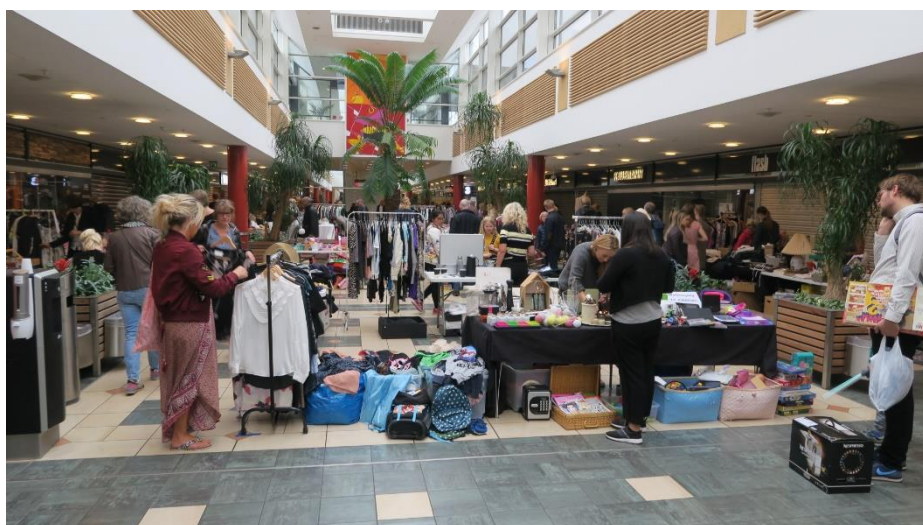
Så kører butikken