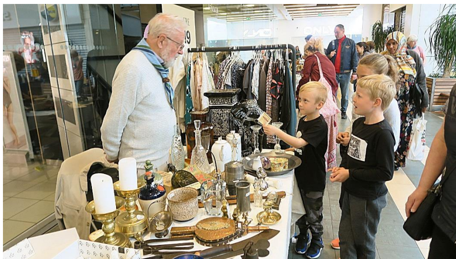
Skal vi sige 100 kr.