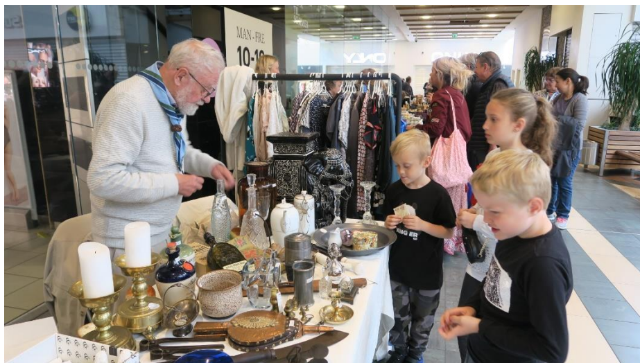
En dreng vil købe