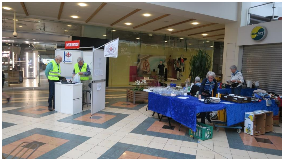
Så er vi klar