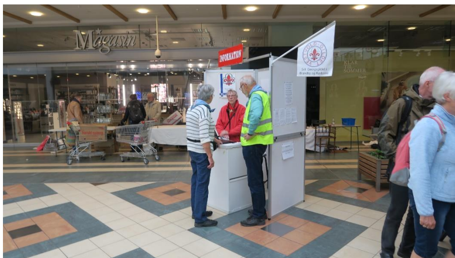
Infoen tager gerne imod