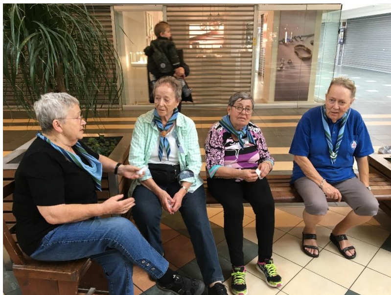
Fire trætte damer