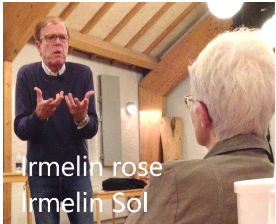
Armelin rose Armelin Sol