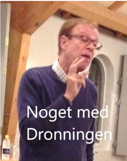
Noget med Dronningen