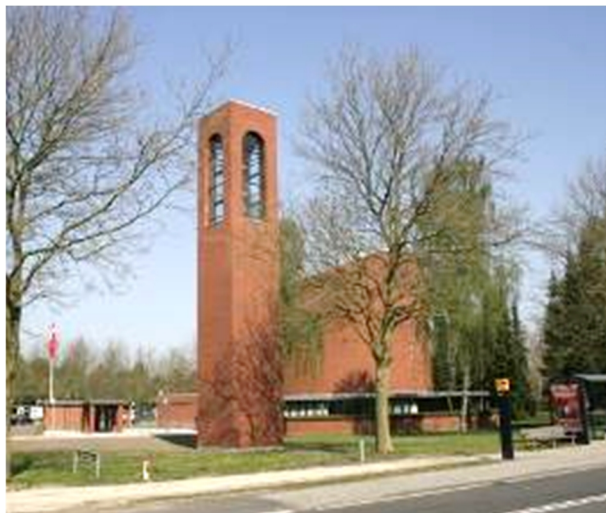
Østervangkirken, Dommervangen 2 2600 Glostrup

Referat fra DistriktsGildeHal i den 26. februar 2018