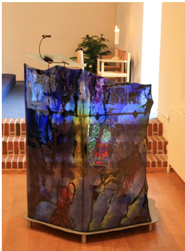
Talerstol af glas