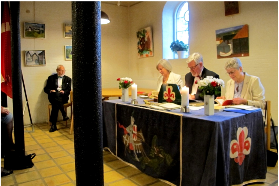
Så har den nye kansler indtaget sin plads til højre for Gildemesteren