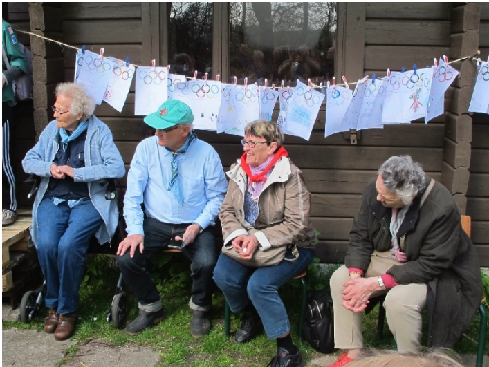
En flok friske ved sidste års UlveLøb