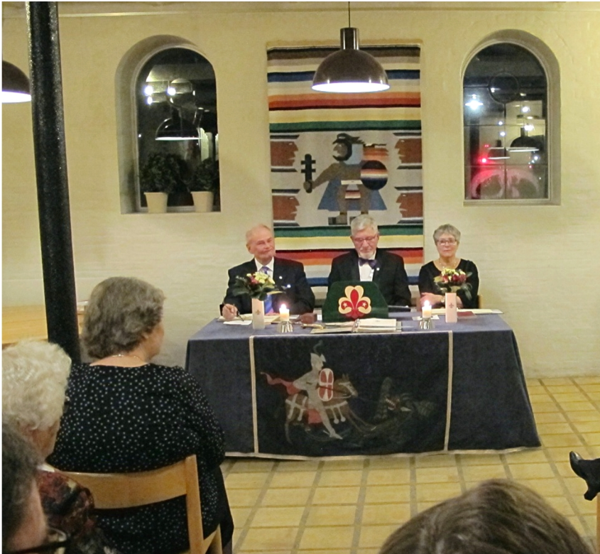
Fra NytÅrsGildeHallen 2016