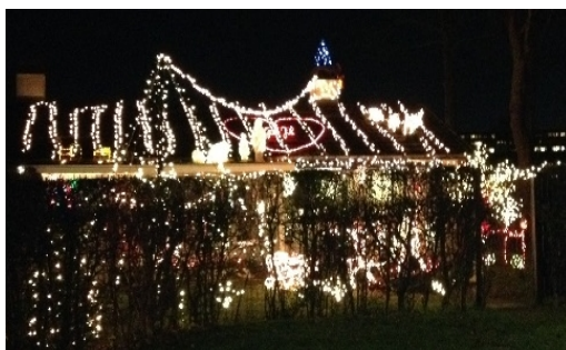
Lidt af genboens juleudsmykning

Alle i gildet ønskes en rigtig Glædelig jul