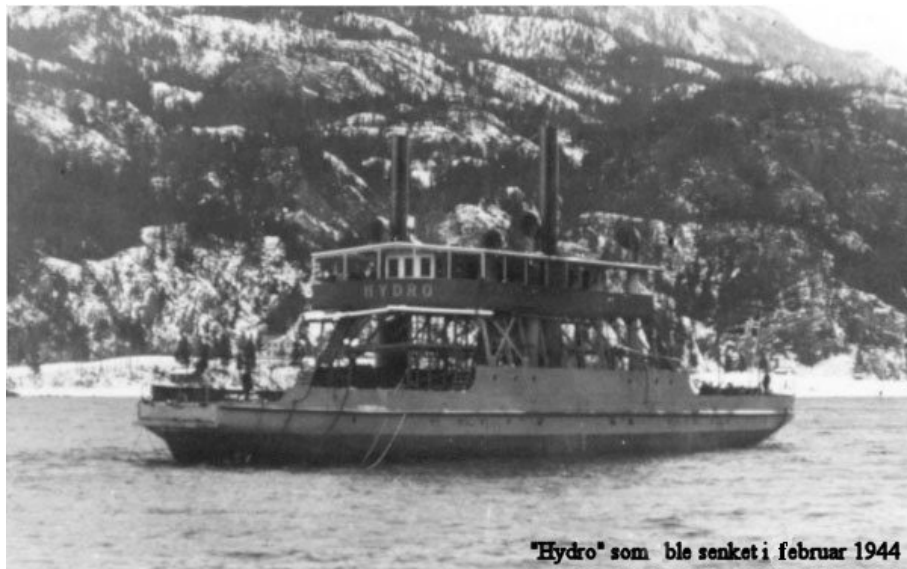
"Hydro" som ble senket i februar 1944